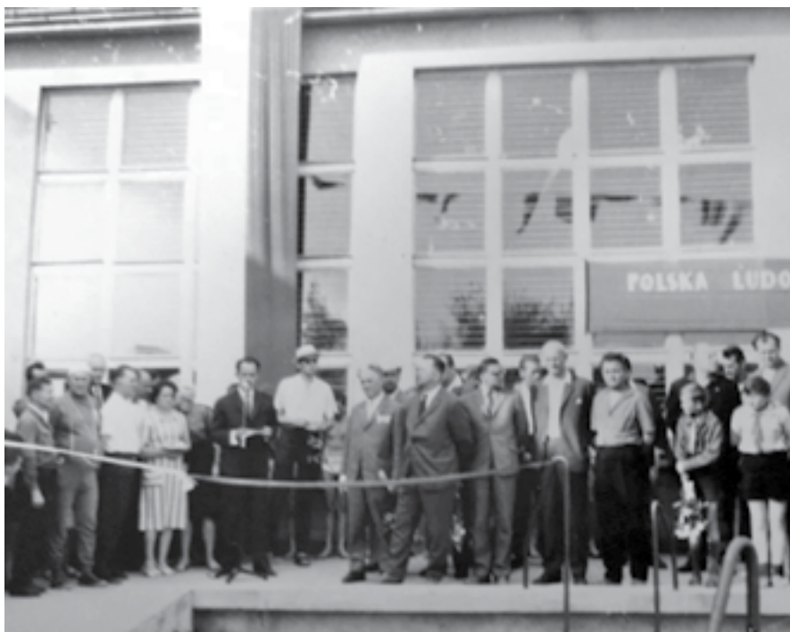
Ryc. 7. Uroczystość otwarcia basenu przy Szkole Podstawowej nr 6, 1966