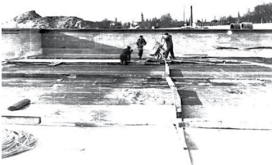
Ryc. 1. Budowa niecki basenowej kąpieliska miejskiego w Zduńskiej Woli

ści społecznej (prace porządkowe i inwestycyjne) sprawiła, że Zduńska Wola otrzymała nagrodę w wysokości 750 tys. zł, która w całości została przeznaczona na budowę kąpieliska miejskiego.