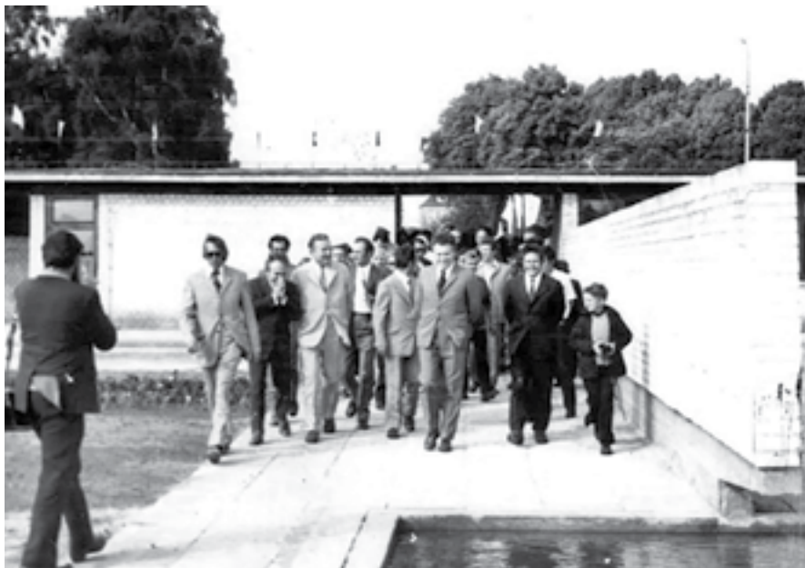
Ryc. 2. Uroczyste otwarcie kąpieliska miejskiego w Zduńskiej Woli, 22.07.1973

Z końcem 1972 r., władze miejskie na podstawie uchwały nr 88/346/72, utworzyły z dniem 1 stycznia 1973 r. na bazie powstającego kąpieliska miejskiego, Miejski Ośrodek Sportu, Turystyki i Wypoczynku „Relaks” (MOSTiW), przekształcony w 1975 r. na Miejski Ośrodek Sportu i Rekreacji (MOSiR) „Relaks”. Równocześnie zatwierdzono statut organizacyjny tego ośrodka (zarządzenie Naczelnika Miasta nr 40/75 z dnia 29 listopada 1975 r.) 6 .