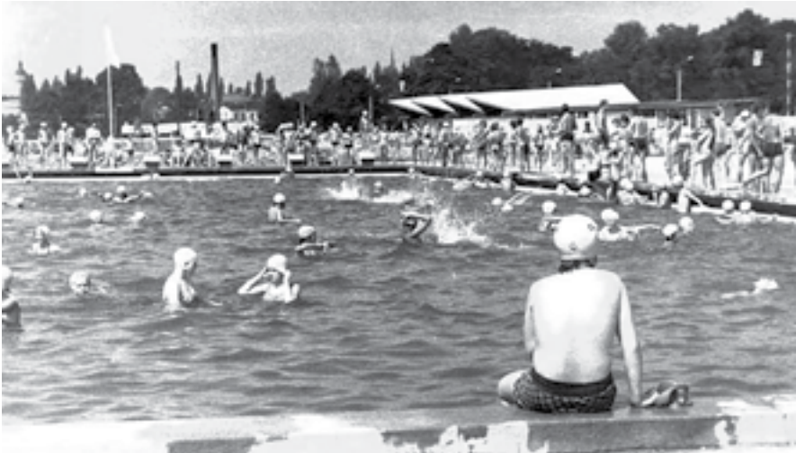
Ryc. 3. Kąpielisko miejskie po otwarciu dla mieszkańców Zduńskiej Woli