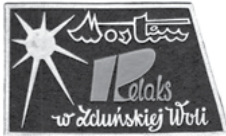
Ryc. 4. Znaczek filcowy – pierwszy logotyp używany przez MOSTiW „Relaks” (1973-1975)

Pomysł budowy kąpieliska okazał się bardzo pożyteczną i dobrą inicjatywą dla społeczności Zduńskiej Woli, gdyż frekwencja na basenach była tak ogromna, że postanowiono przeprojektować obiekt, i w latach 1971-1972 Miejski Zespół Urbanistyczny (MZU) opracował nowy plan zagospodarowania otoczenia kąpieliska. W 1974 r. powstały nowe budynki, wybudowano wielofunkcyjne boisko asfaltowe, a następnie je oświetlono, powstało nagłośnienie, wyposażono wypożyczalnię sprzętu letniego i zimowego. Także dzięki działanom MZU zagospodarowano fragment terenu pomiędzy ulicami Łaską a Mikołaja i stworzono dogodne dojście z centralnej arterii miejskiej do kąpieliska miejskiego, powstała aleją ZWM (ob. F. Rajczaka).