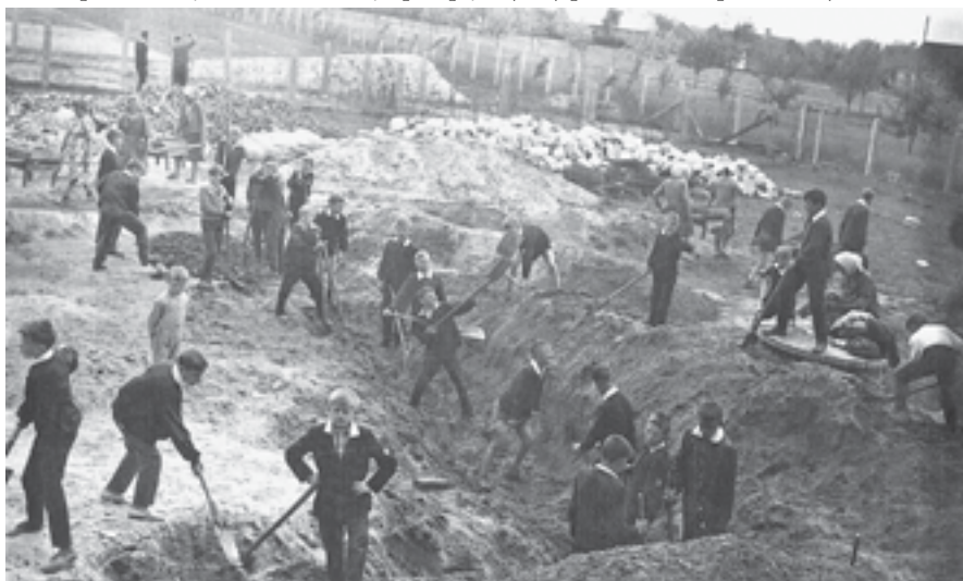
Ryc. 6. Prace ziemne przy budowie basenu na terenie szkoły przy ul. Złotej, 1965