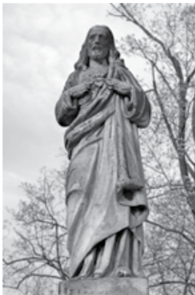
Ryc. 13. Pomnik Władysława Idzikowskiego na cmentarzu w Sieradzu (figura)