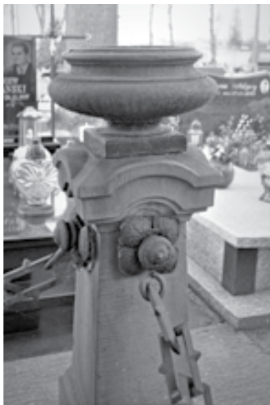
Ryc. 7. Pomnik rodziny Bąkowskich na cmentarzu w Zduńskiej Woli – zbliżenie na elementy ozdobne i elementy metalowe