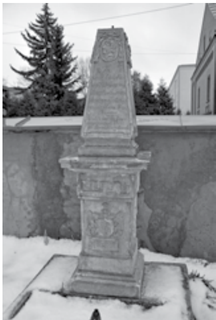
Ryc. 1. Nagrobek Macieja Wyszyńskiego na placu Kościelnym w Łodzi