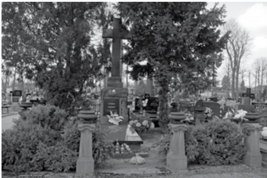
Ryc. 5. Pomnik rodziny Bąkowskich na cmentarzu ewangelickim w Zduńskiej Woli