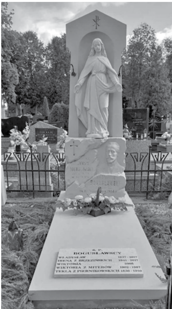
Ryc. 4. Pomnik Piotra Bogusławskiego na cmentarzu katolickim w Zduńskiej Woli