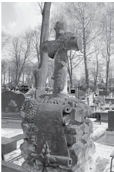
Ryc. 9. Pomnik rodziny Brock (przed renowacją) na cmentarzu ewangelickim w Zduńskiej Woli