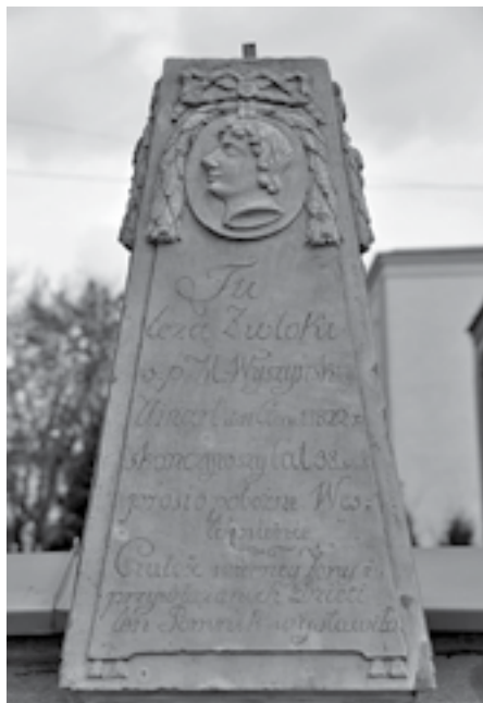
Ryc. 2. Zbliżenie na nagrobek Macieja Wyszyńskiego na placu Kościelnym w Łodzi