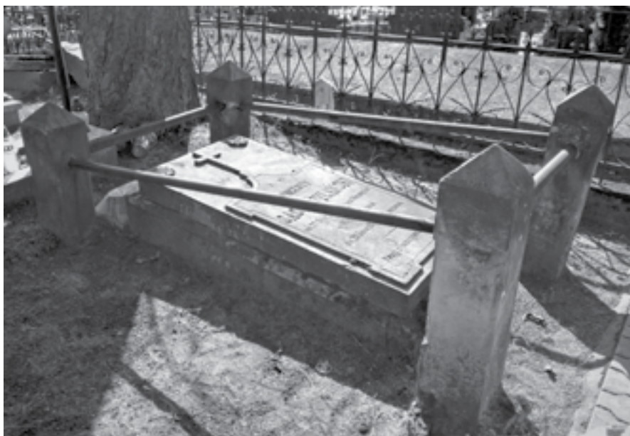
Ryc. 14. Pomnik Wincentego Sasa Kobyłańskiego na cmentarzu parafialnym w Marzeninie