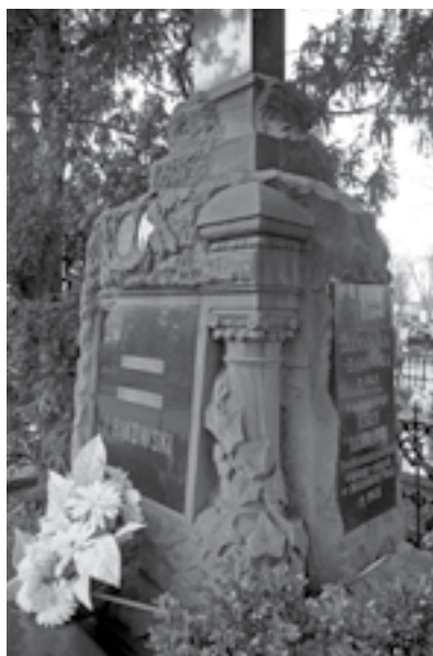
Ryc. 6. Pomnik rodziny Bąkowskich na cmentarzu ewangelickim w Zduńskiej Woli (zbliżenie)